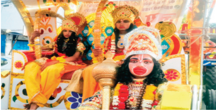
नगर में स्थान-स्थान पर पुष्पवर्षा से हुआ स्वागत, अभिनंदन

हरिभूमि न्यूज़ ▶▶ राजगढ़ माली, पुष्पद समाज द्वारा अपने आराध्य भगवान राम का जन्मोत्सव शनिवार को धूमधाम एवं शोभायात्रा के साथ मनाया गया। प्रतिवर्षानुसार इस वर्ष भी यह चल-समारोह नेवज तट स्थित खेड़ापति हनुमान मंदिर से आरंभ हुआ, जो गाजे-बाजे एवं ढोल-टमाकों के साथ नाका नंबर-3, मेन मार्केट, जय स्तंभ चौक, किला क्षेत्र, पुरा होते हुए बड़ा हनुमान मंदिर पहुंचा। यहां पूजा-अर्चना उपरान्त चल-समारोह बमबम आश्रम के नजदीक स्थित समाज की धर्मशाला पहुंचकर समाप्त हुआ। इस